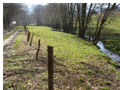
Bild rechts: Mörshäuser mit Schildern zu Flurnamen, die in der Gemarkung aufgestellt wurden